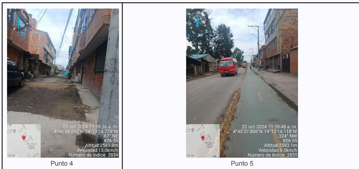
Ilustración 2. Fotos de los puntos del Recorrido de Control Y Vigilancia.