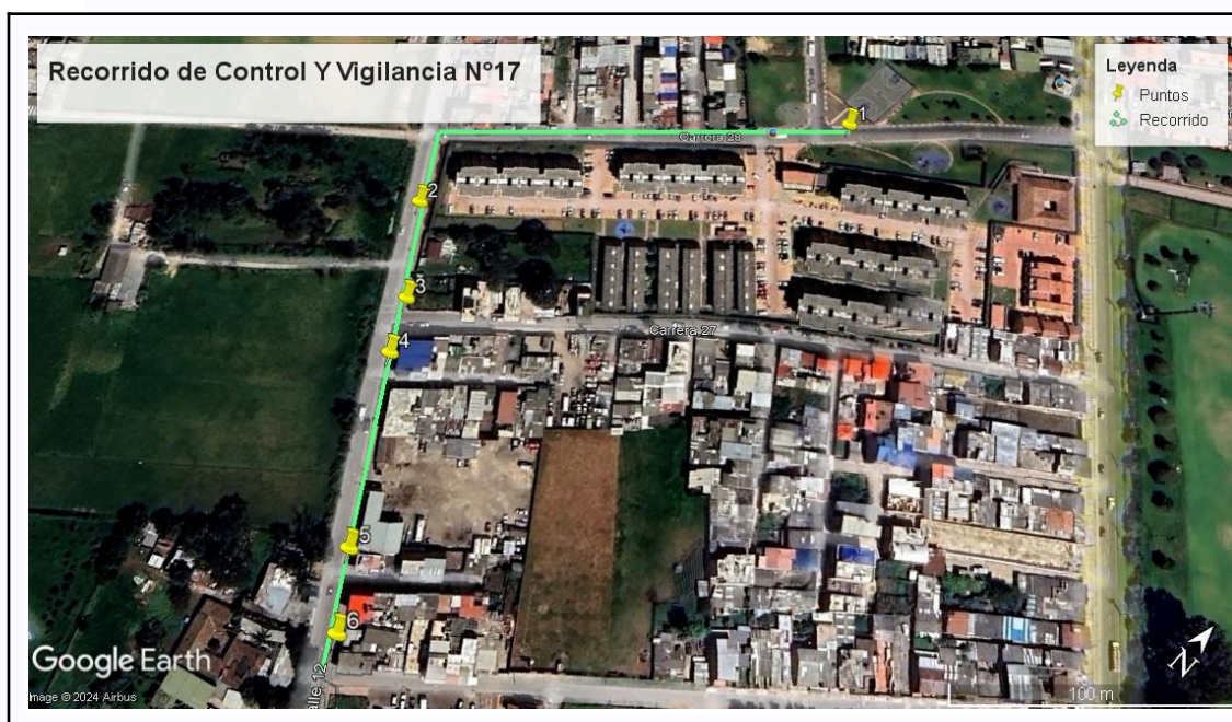
Ilustración 1. Recorrido de Control Y Vigilancia N°17

Con base en lo anterior, el día 22 de octubre del 2024 se realizó recorrido de control y vigilancia en el barrio Siete Trojes, cuadrante 3 desde las coordenadas 4°43'47,754" N- 74°13'13.944"W hasta las coordenadas 4°43'37,806" N- 74°12'14.118"W (ver ilustración 1. Ruta verde)